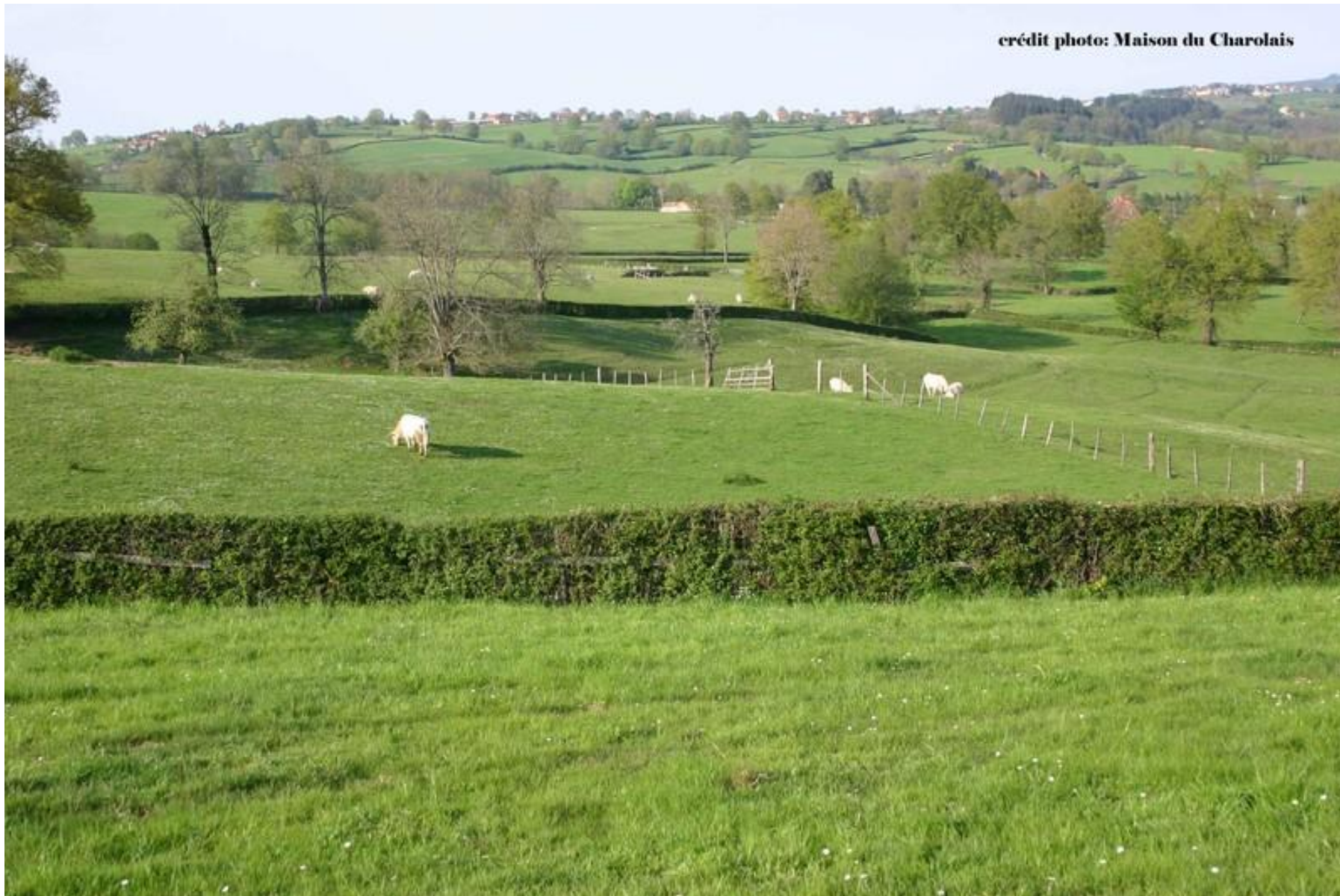
Document 2 : Paysage du Charolais, Source : site de la Maison du Charolais, http://p7.storage.canalblog.com/78/86/306310/18877635.jpg , Consulté le 15 février 2013.